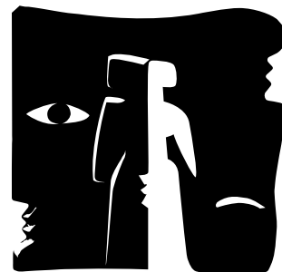
PRIX DE L'INNOVATION CÉSAR & TECHNIQUES

* Évolue et devient à partir de 2018 le «Prix de l'Innovation César & Techniques»