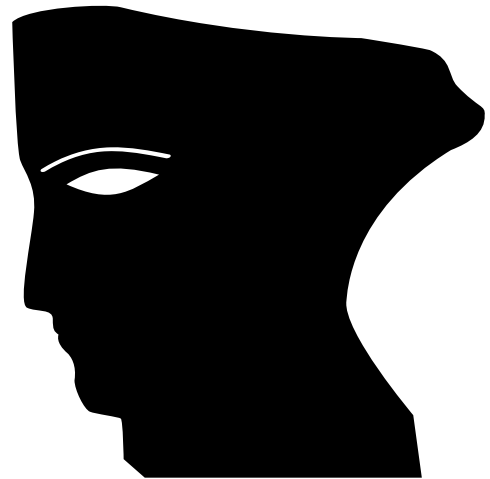
TROPHÉE CÉSAR & TECHNIQUES