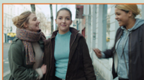
AVALER DES COULEUVRES

Court Métrage CÉSAR 2019 Sélection Officielle