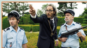
PANIQUE AU SÉNAT