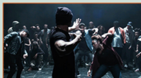
LES INDES GALANTES