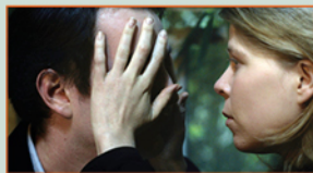
UN PEU APRÈS MINUIT