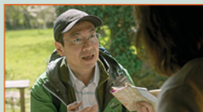
ATO SAN NEN