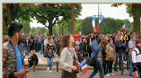
HANNE ET LA FÊTE NATIONALE

Court Métrage CÉSAR 2019 Sélection Officielle