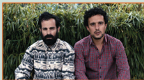
POURQUOI J'AI ÉCRIT LA BIBLE