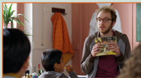
MASTER OF THE CLASSE