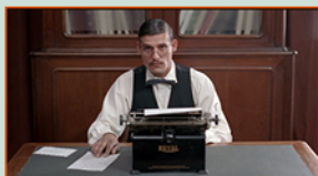
COMMENT FERNANDO PESSOA SAUVA LE PORTUGAL