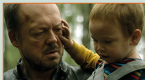
LES PETITES MAINS