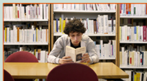
GRAIN DE POUSSIÈRE