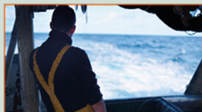
L'ÂGE DES SIRÈNES